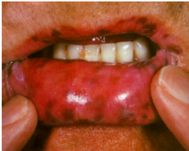
(圖二.圖片取自於 A Colour Atlas of the Digestive System, Wolfe, London 1989 p. 118.)

約 95%的 PJS 患者會出現皮膚黏膜黑色素沉著，黑色素沉著通常是平坦的，呈藍灰色到褐色，大小為 0.1-0.5 公分，常見於唇部和口周區域 (圖二)、齒齦、頰部黏膜、手指、手掌、腳趾以及會陰部肛門周圍。黑色素沈著通常在出生後的第一年到第二年內發生，隨著年齡增長，斑點的大小和數量會增加，顏色也會漸漸變深成為黑色斑點，直到青春期後可能逐漸消退，除了頰部黏膜上的斑點。PJS 的皮膚黏膜黑色素沉著可能會被誤認為雀斑(ephelides)。然而，與 PJS 的斑點不同的是，雀斑通常在鼻孔和嘴附近較稀疏，出生時並不存在，並且不會出現在頰部黏膜上。